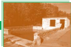
Le lavoir de Fresnel (1).