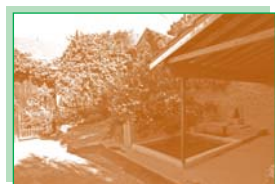
Le lavoir des Roches (7).