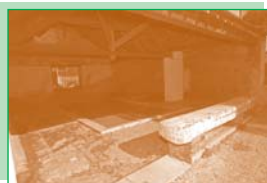
Le lavoir de La Plagne (2).