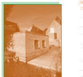
Le lavoir Saint-Jean (8).