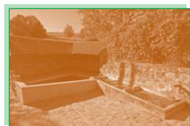
Le lavoir des Fillancourts (5).