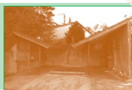
Le lavoir de la Ballanderie (6).