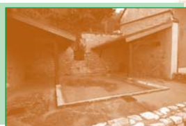
Le lavoir de Saint-Martin (4).