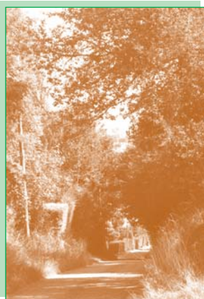
Lisière entre Magnanville et Mantes-la-Ville.