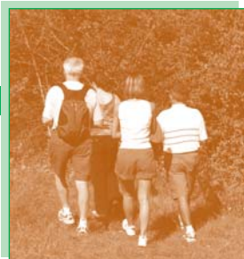
Entrée dans le Bois des Enfers.